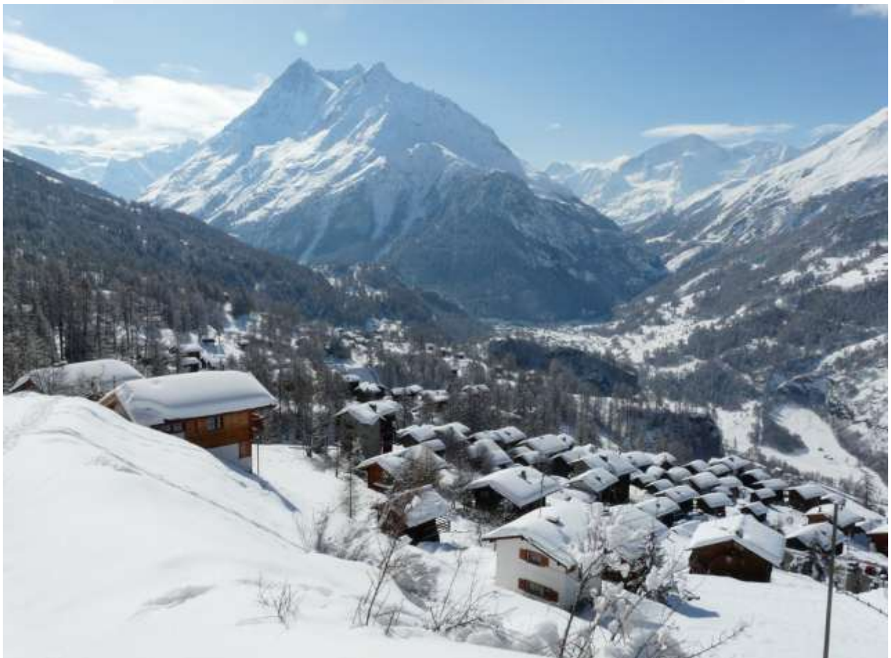
Villaz sous la neige, avec, de gauche à droite, les dents de Veisivi et le Pigne d'Arolla.

Villaz compte quatre-vingt habitants, vivant essentiellement de l'agriculture et du tourisme. Vous serez peut-être le prochain privilégié à découvrir Villaz. L'espace d'un week-end ou d'un séjour, la Famille Gaudin vous propose des logements de charme et fonctionnels : appartements de vacances, bed and breakfast ou chalets de mayen.